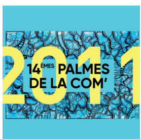
2011 Grégory Berben