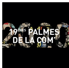
2020 Grégory Berben