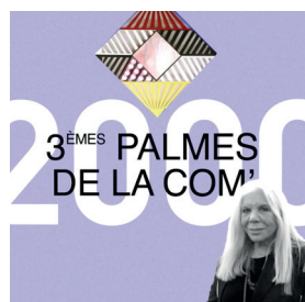
2000 Nivèse Oscari