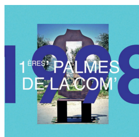
1998 Sacha Sosno